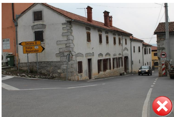
Slika 4: Učenci hodijo do postajališča ob robu ozkega vozišča. Pločnika ni.