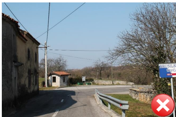
Slika 22: Nevaren odsek iz smeri Dutovlje.