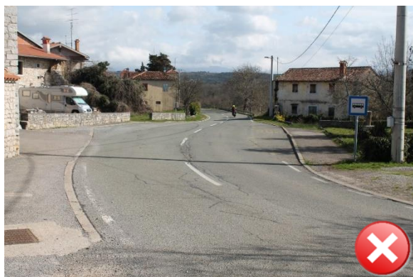
Slika 33: Nevaren odsek iz smeri Štanjel.