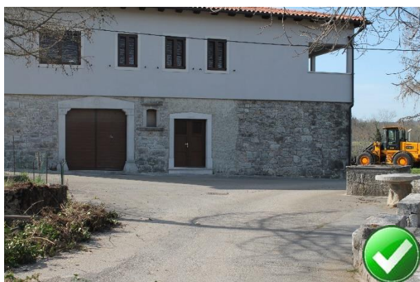
Slika 32: Postajališče ni označeno. Mesto ni problematično, ker vaška ulica ni prometno obremenjena.