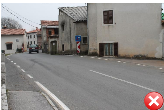
Slika 5: Učenci hodijo do postajališča ob robu vozišča. Pločnika ni.